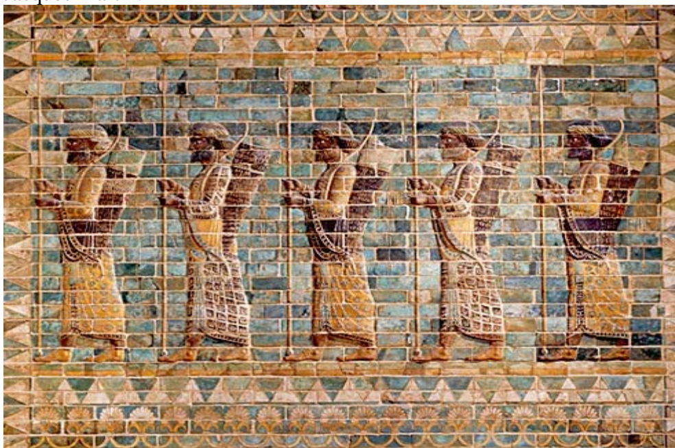
Archers de Darios I er

Zür Bakal : Malgré toutes mes recherches, je n'ai absolument rien trouvé sur cette ville. J'en conclus donc que Jacques Martin l'a inventée pour les besoins de l'intrigue de « La Tiare d'Oribal » et en a fait le modèle-type d'une capitale mésopotamienne au Ier siècle av J.C. Elle est assez souvent représentée dans les récits d'Hiram Khal et Adroclès, son architecture est semblable à celle des cités perses achéménides telles que Persépolis ou Suse. Dans « La Tiare d'Oribal » cette ville apparaissait comme une sorte de copie de Babylone avec ses jardins suspendus dans lesquels se promène Arbacès. Peut-être était-ce là l'intention initiale de Jacques Martin.